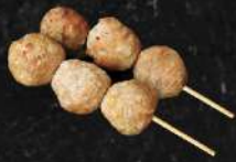
BOULETTES POULET FROMAGE