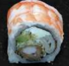
STORE crabe, surimi, cheese, ebi, avocat, gambas