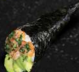
SAUMON, AVOCAT, CIBOULETTE