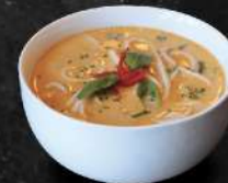
SOUPE RED CURRY

curry rouge, nouilles, lait de coco, poireau, brocoli, tomate cerise, oignon, gingembre, citronnelle, carotte, huile de sésame