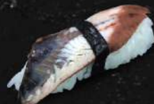
ANGUILLES 35 DH