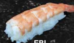
EBI 30 DH