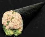
SAUMON CUIT, AVOCAT, CHEESE