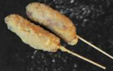
POULET FROMAGE PANÉ