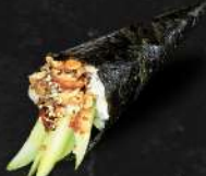
ANGUILLES GRILLÉES, CONCOMBRE