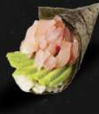
POISSON BLANC, AVOCAT, CIBOULETTE