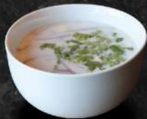
SOUPE TOM KHA

lait de coco, citronnelle, tomate cerise, champignon, citron, fish sauce, galanga, oignon