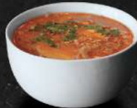
SOUPE TOM YAM

45 DHS VÉGÉTARIENNE 50 DHS POULET 55 DHS BOEUF 65 DHS GAMBAS 65 DHS FRUITS DE MER