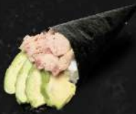
THON CUIT, AVOCAT, CHEESE