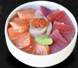
CHIRASHI SAUMON / THON / POISSON BLANC