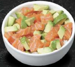
CHIRASHI SAUMON AVOCAT