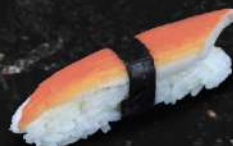
SURIMI 25 DH