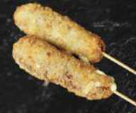
BOEUF FROMAGE PANÉ