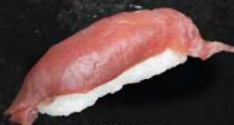
THON 35 DH