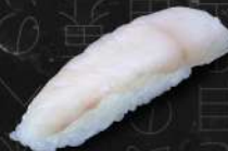
POISSON BLANC 35 DH