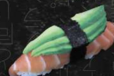
SAUMON AVOCAT 35 DH