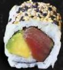
THON OU THON ÉPICÉ