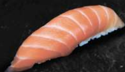
SAUMON 35 DH