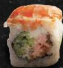
SHIGA saumon pané, concombre, ebi, cheese