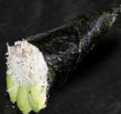
CHAIR DE CRABE, AVOCAT